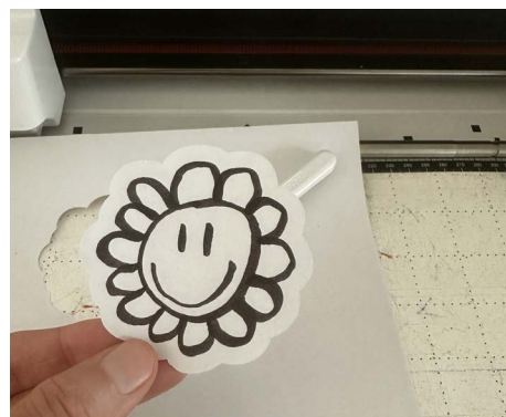
... und mit kleinem Offset mittels Direktschnitt ausgeschnitten.