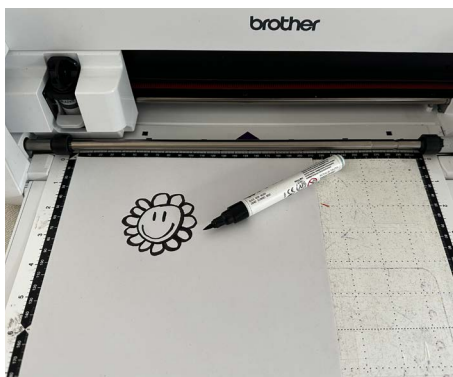
Zeichnung auf Papier wird eingescannt ...

Dazu legst du deine Vorlage auf die (nicht zu stark klebende Schneidematte) und scannst sie ein. Hast du eine gute Vorlage mit klaren Begrenzungslinien, kannst du direkt am Gerät ein Offset erstellen und deine Vorlage ausschneiden lassen.