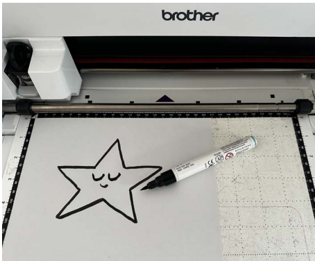
Zeichnung auf Papier wird eingescannt ...