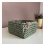
Eckiger Korb mit Holzboden Seite 86