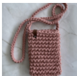
Handytasche Seite 80