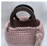
Tasche mit Lederboden Seite 90