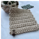
Topflappen Seite 36