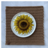
Eckiges Platzset Seite 54