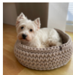
Hundekorb Seite 92