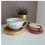
Tassenuntersetzer Seite 48