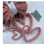
Deko-Herz Seite 56