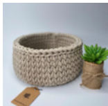
Brotkorb Seite 70