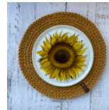
Rundes Platzset Seite 52