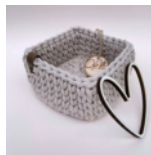
Eckiger Korb Seite 62