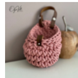
Hängekörbchen Seite 42