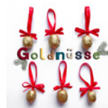
Goldnüsse Seite 102