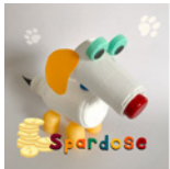
Spardose Seite 68