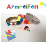
Armreifen Seite 60