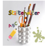
Stiftehalter Seite 88