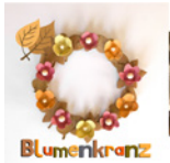
Blumenkranz Seite 64