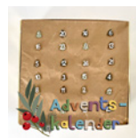
Adventskalender Seite 116