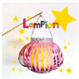
Lampion Seite 76