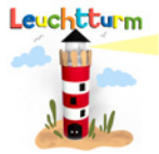
Leuchtturm Seite 56