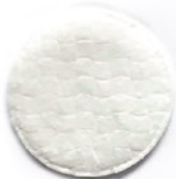
2 Watte pads