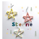
Sterne Seite 112