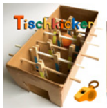
Tischkicker Seite 72