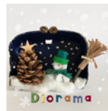
Diorama Seite 106