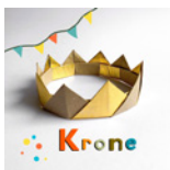
Krone Seite 82