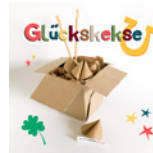
Glückskekse Seite 92