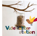
Vogelfutterstation Seite 98